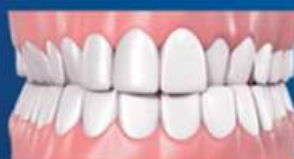
LA MORDIDA CRUZADA