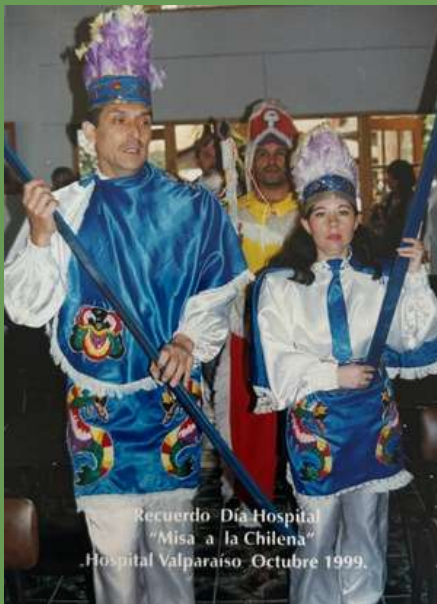
Recuerdo "Día Hospital "Misa a la Chilena" Hospital Valparaíso- Octubre 1999.