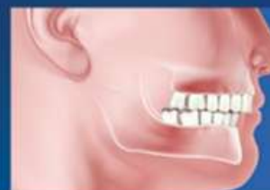
LA DESALINEACIÓN MANDIBULAR