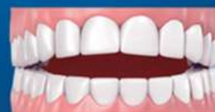
LA MORDIDA ABIERTA